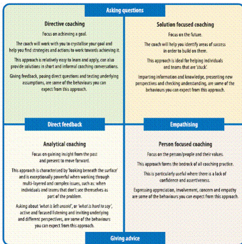
Fig.2 Riadattato da De Haan and Burger 2005

Agenzia Nazionale per lo Sviluppo dell'Autonomia Scolastica Le specificità del progetto Cl@ssi 2.0 non prevedono un modello rigido di coach, ma necessitano di linee guida flessibili che consentano di avviare un'analisi a partire dal contesto e dai bisogni reali della scuola, per innescare un processo di riflessione finalizzato al miglioramento e all'innovazione. Una proposta valida proviene da un riadattamento del lavoro di Hann and Burger (2005) i quali individuano diversi stili di coaching vi :